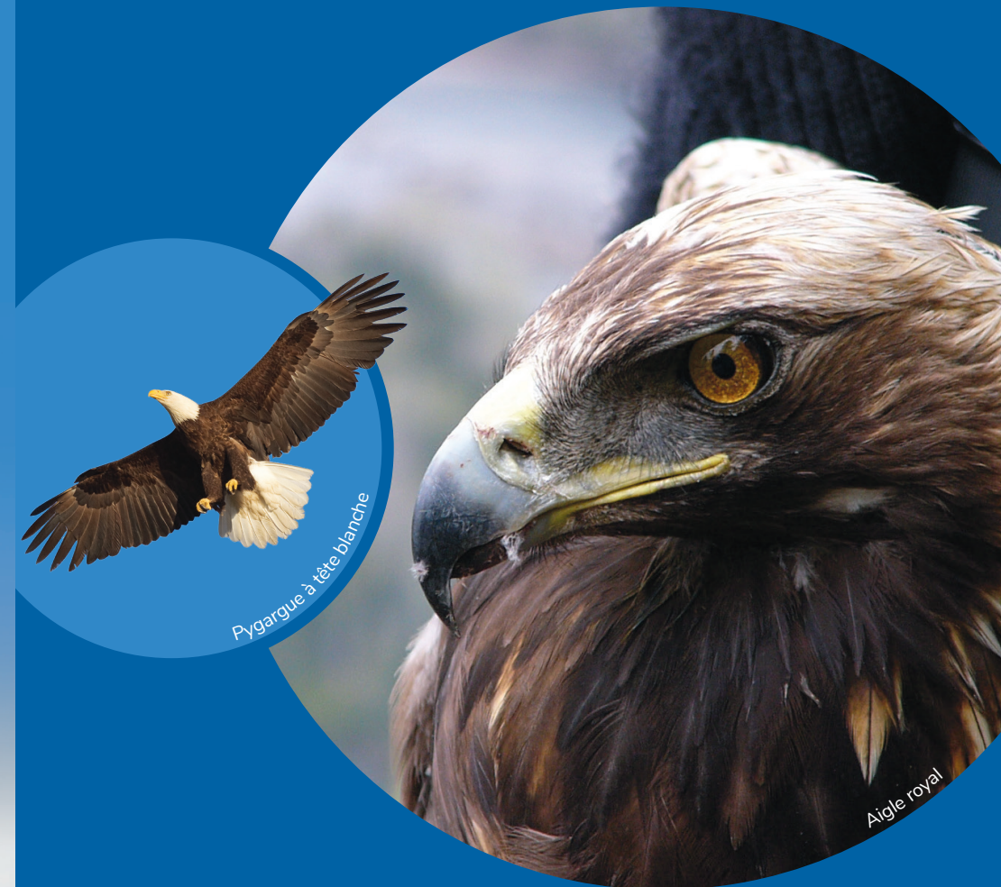
Pygargue à tête blanche

Photos couverture : Aigle royal - Philippe Beaupré, MFFP Pygargue à tête blanche - Luc Farrell Photo dos : Frédérick Lelièvre